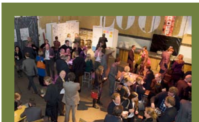
Achter de schermen

De programmastructuur is een bewezen manier om verandering op een goede manier te managen. Het balanceert het sturen op doelen met het realiseren van concrete resultaten. Verandering is binnen organisaties aan de orde van de dag en reorganisaties blijven elkaar opvolgen. Een programma-aanpak kan dus kansen bieden voor de inrichting van een staande organisatie. We laten zien hoe binnen NXP semiconductors (voormalig Philips) een succesvol programma is omgezet in een staande organisatie door de programma-principes vast te houden en praktisch/pragmatisch vorm te geven. We staan stil bij deze case en laten ook zien aan de hand van andere voorbeelden wat manieren zijn om binnen een grote organisatie je afdeling in te richten op constante verandering. Organisatiestructuur, tools, reporting en impact op de mens komen aan bod. Niet academisch, maar pragmatisch op basis van eigen ervaring.