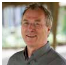
Hans Licht Organisatieregie*