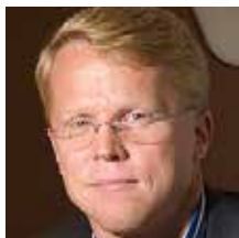
Hans Cremer Brooke Institute

Het PGM Open is georganiseerd door Brooke Institute en SPITZ congres en event.