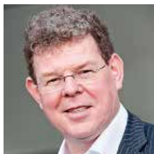
Jo Bos Jo Bos & Co